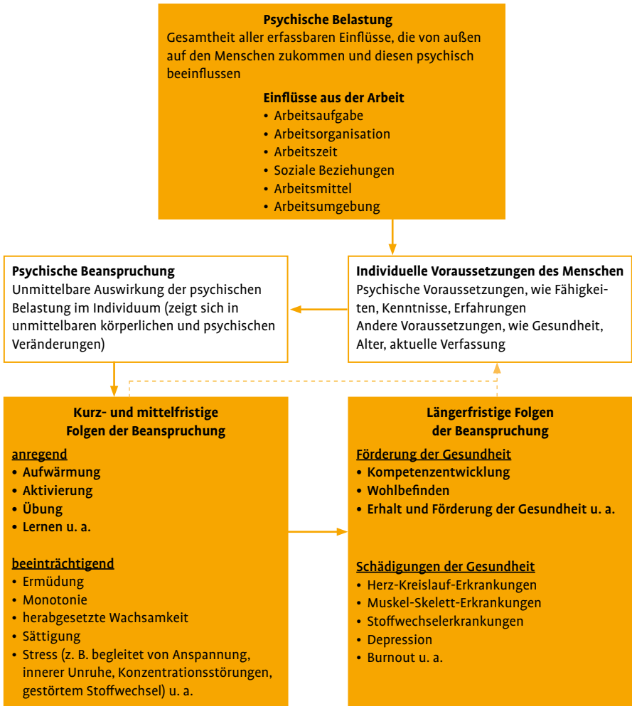
Abbildung 1: Psychische Belastung, Beanspruchung und Beanspruchungsfolgen